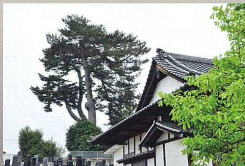
天童家の菩提寺宝国寺と末の松山