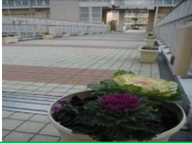
デッキに花を咲かせよう！ 2階デッキ、1階通路には住民が寄せ植えした花々が並び、目を楽しませています。