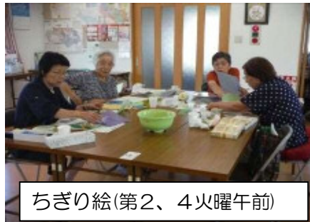
ちぎり絵(第2、4火曜午前)