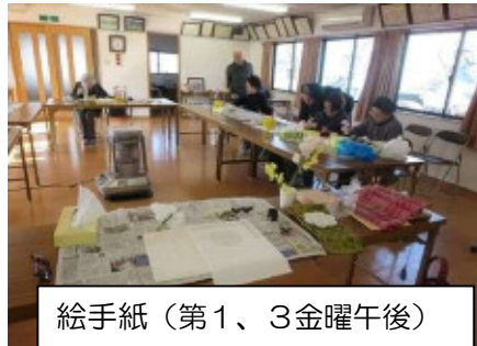
絵手紙 (第1、3金曜午後)