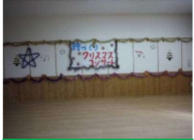
クリスマスコンサート 昼食会の後、ワークショップで楽器を作り、多賀城吹奏楽団アンサンブルの演奏を聴きました。作った楽器で、一緒に演奏したり、音楽に合わせてプレゼント回しゲームも楽しみました。