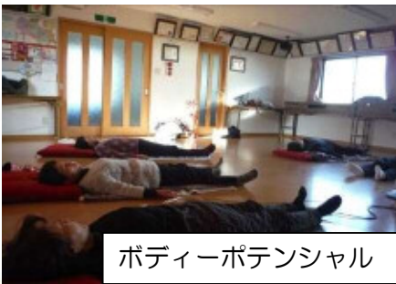
ポディーポテンシャル