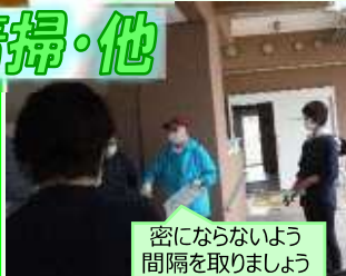
密にならないよう 間隔を取りましょう