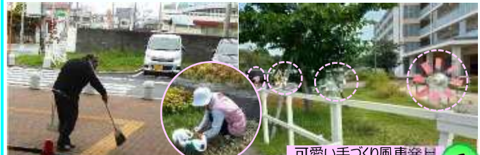
可愛い手づくり風車発見

自主的に共用部の清掃・花壇の手入れをしている方々や環境管理の方々のおかげで、美観が保たれている 一斉清掃は3ヶ月毎、今回取材できず