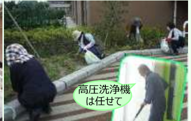
高圧洗浄機 は任せて