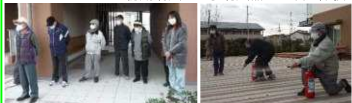
訓練前に「部屋の中で非常ベルの聞こえ方を確認」と住民へ連絡。反省会では「聞こえにくい」「対策が必要!!」の声があがりました。