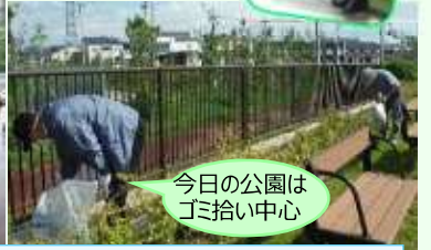
今日の公園は ゴミ拾い中心

★コロナ対策: 偶数階と奇数階の参加月を分け少人数で少人数の一斉清掃でやりきれない住宅周辺や公園の草取りは、時間のある時、環境管理部や有志で実施