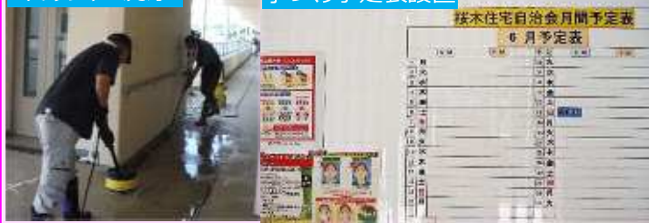
手づくり予定表設置