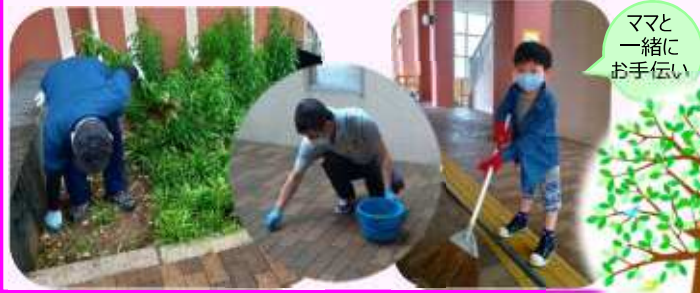
ママと 一緒に お手伝い

この日は、共用部分の掃き掃除と草取り、手すりやエレベーターの拭き掃除など…終了後は役員が資源回収に巡回