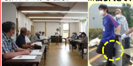
他地域の取り組みは、大変勉強になりました！