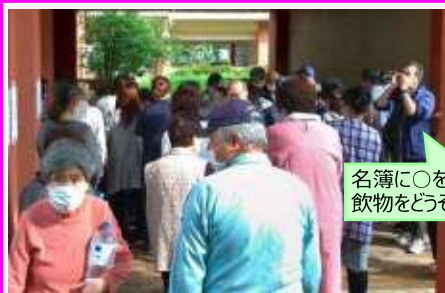
名簿に〇を… 飲物をどうぞ