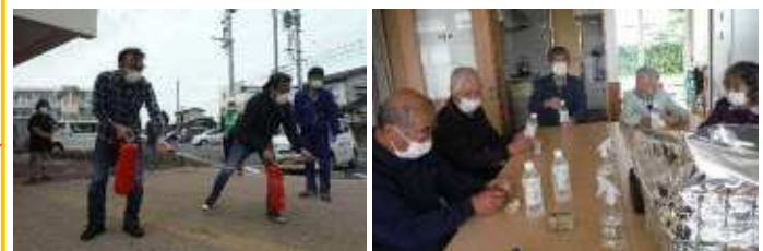
水消火器は参加者全員が体験 反省会&非常食の試食実施