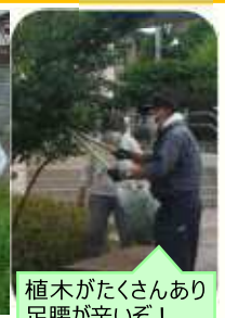
植木がたくさんあり 足腰が辛いぞ！

この日は、共用部分の掃き掃除と草取り、手すりやエレベーターの拭き掃除など…終了後は役員が資源回収に巡回